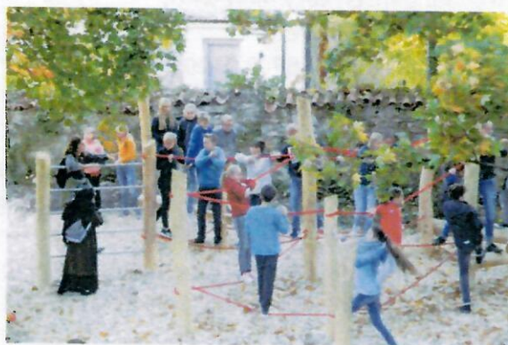
Der neue Parcours wird sehr gut angenommen.

Einen Beitrag in Höhe von 1.500 € haben die Eltern bereits 2017 zur Neugestaltung des Schulhofs geleistet. Der Bolzplatz hinter dem D-Bau hat neue Fußballtore bekommen; außerdem wurde dort, teilweise mit aktivem Einsatz von Schülern und Lehrern, ein Bewegungsparcours gebaut, der von den Schülerinnen und Schülern eifrig genutzt wird. Zwischen A-Bau und Echaz wurde die Terrasse, die während der Zukunftswerkstatt 2013 von Schülerinnen und Schülern gebaut wurde, mit Sitzgelegenheiten versehen. Weitere Bautätigkeiten für die Schulhofgestaltung (zum Beispiel mehr Sitzgelegenheiten) werden folgen.